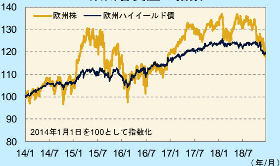
欧州各資産の指数