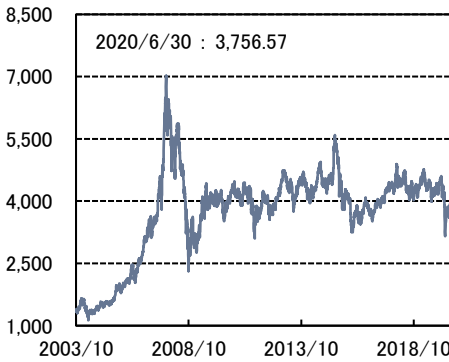
ハンセン中国レッドチップ指数