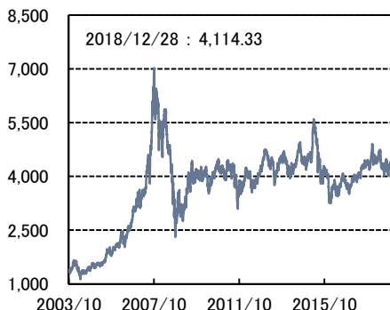
ハンセン中国レッドチップ指数