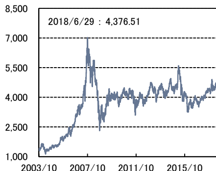
ハンセン中国レッドチップ指数