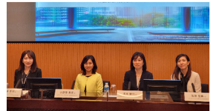
パネルディスカッション登壇者

パネリストとして業界の第一線で活躍する女性リーダーたちが登壇し、「臆せずチャレンジすることが大事」「他の方と比べない、一歩でも半歩でもいいから進む。」など、自身のキャリア形成や転換期での前向きな姿勢を伺うことができました。参加者からは「ロールモデルではなく『ロールパーツ』という考え方を初めて知り、重要な考え方だと思った。」「キャリアを積んでいる人はみな、チャレンジしたからこそその結果だと分かった。」といった声をいただくなど、大盛況のうちに終わりました。今回の参加者は男性が3割を超えており、年齢層も幅広く、業界全体における女性活躍推進への関心の高さを再認識しました。(次頁の参加者アンケート参照)